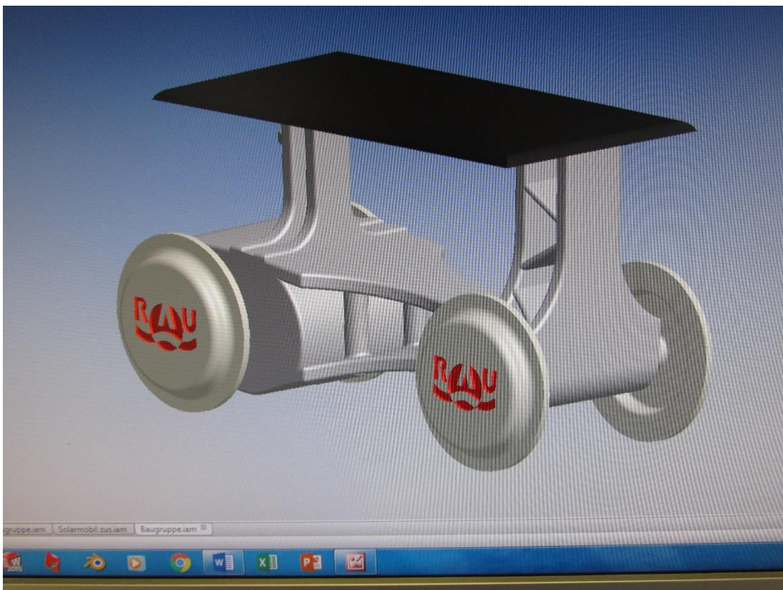
Baugruppe Solarmobil (RAU)